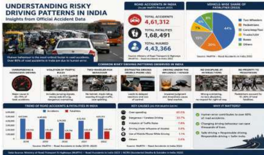
Figure: Driving Patterns in India: Insights from Road Accident Data

Distraction due to mobile phone use is an emerging and underreported risk. While officially recorded cases are lower, studies and enforcement data suggest that actual prevalence is much higher, contributing to delayed reaction times and loss of vehicle control.